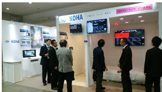
マイクロ波センサ内蔵LED照明による デモ展示

また、従来の光源よりも熱照射の少ないLEDの特長を活かし、医療機器に向けた高輝度LEDモジュールの展示も致しました。